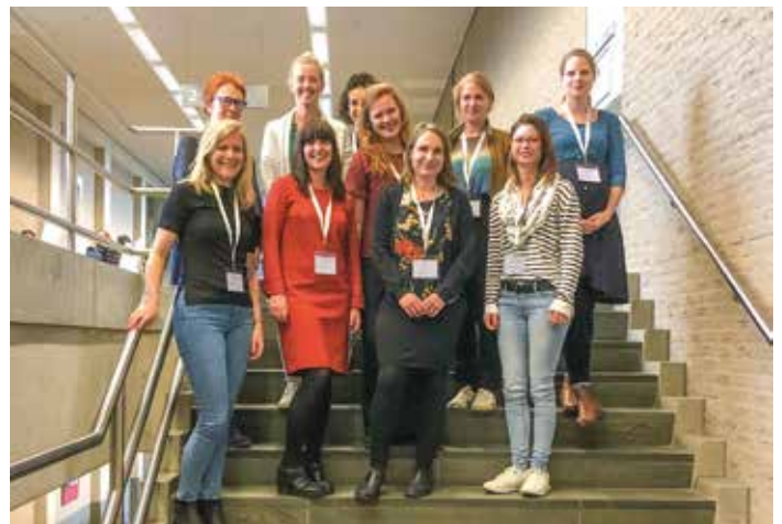
Deelnemers paper-in-a-day .

Door het samen bekijken en bediscussiëren van methoden en resultaten, soms met zijn allen en soms in groepjes, losten we onze vragen op en kregen we nieuwe ideeën. Het